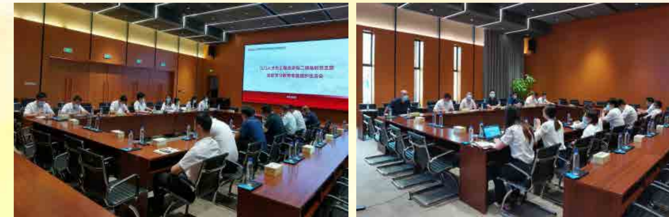
江门人才岛总包二部临时党支部召开党史学习教育专题组织生活会